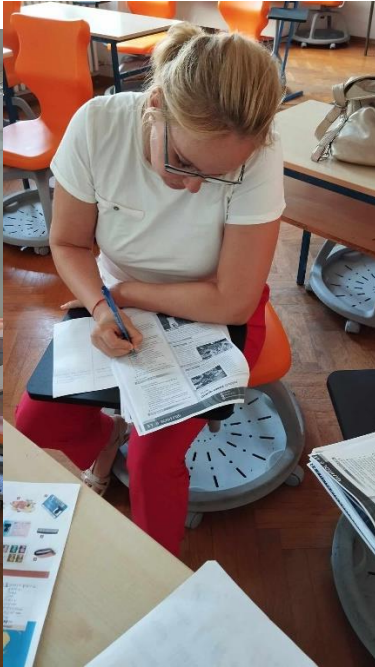
Folyik a munka..