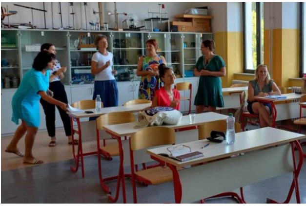
Az olaszos csapattal a végén