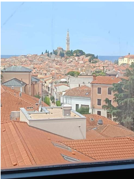
Kilátás a tanteremből. ☺